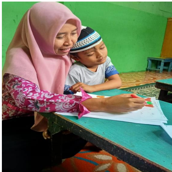
Gambar 3. Sikap jenuh anak

menjangkau minat dan motivasi seluruh siswa.