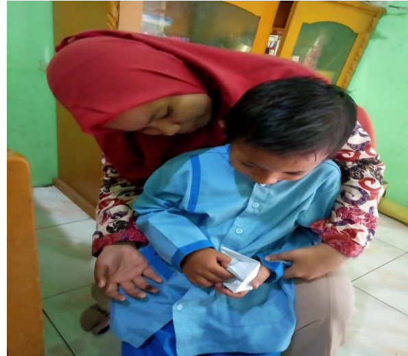
Gambar 2. sikap tidak antusias untuk belajar

tidak meminati materi yang diajarkan, penjelasan yang sulit untuk dicerna melalui daring juga menyebabkan kehilangan motivasi pada anak untuk belajar.