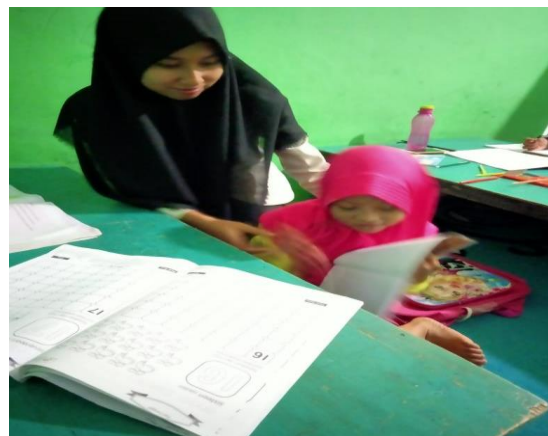
Gambar 4. Anak Menolak untuk belajar

Menurunya motivasi siswa di RA Hidayatullah Medan marelان juga di tandai dengan adanya sikap membangkang yang ditunjukkan oleh beberapa anak. Ketika guru memberikan tugas, beberapa anak tidak suka atau menolak tugas ini, seperti dengan ungkapan ‘tidak mau’, ‘capek’, ‘males’ dan sebagainya. Berdasarkan analisis peneliti terhadap perilaku ini sebenarnya perilaku ini menunjukkan tentang menurunnya motivasi anak mengikuti pembelajaran yang menurut mereka semakin hari semakin membosankan, karena tak dapat bertatap muka, dan bermain bersama, dalam hal ini tentu muaranya ialah tidak tersedianya ruang untuk menyalurkan minat mereka.