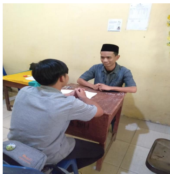
Gambar 2. Prosesi Wawancara Bersama Guru BK MAN 1 Aceh Tenggara

benar Pak, selama Covid-19 saya kan jarang menangani kasus siswa karena belajar sistem online. Tapi, setelah pandemi ini jumlah kasus siswa terlambat mengerjakan tugas lumayan meningkat. Makanya, kami sebagai guru BK memberikan layanan format klasikal untuk memotivasi siswa dalam mengerjakan tugas. (Wawancara 10 November 2022).